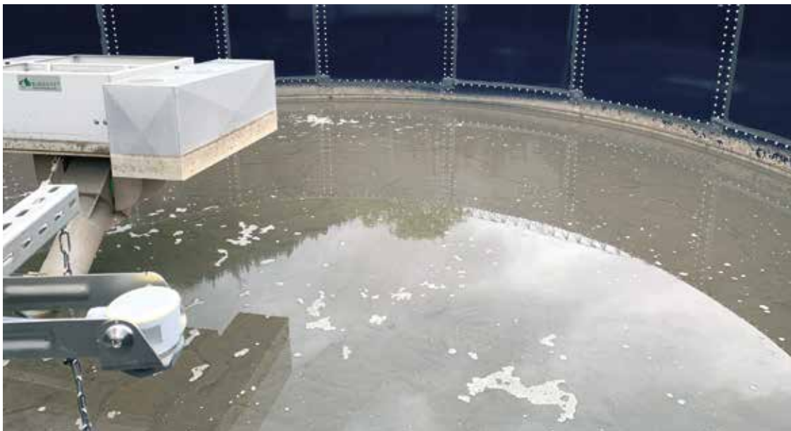
Abb.: Einsatz am SBR Reaktor in Zernez (Schweiz)