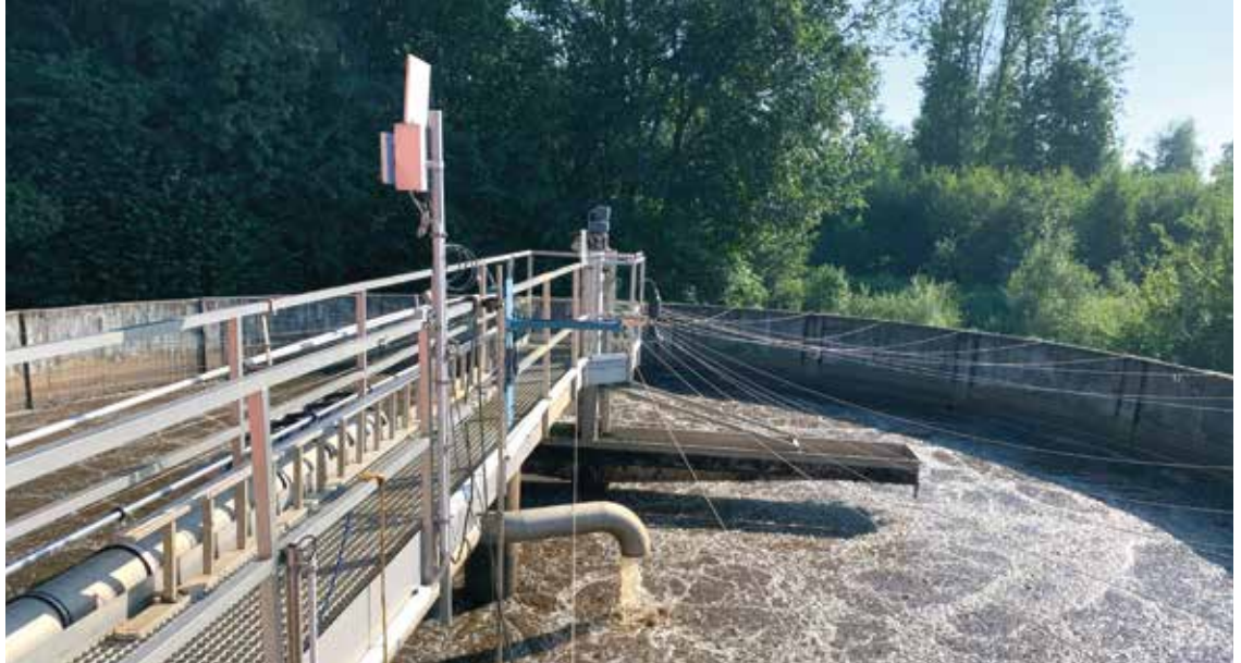
Abb.: Einsatz am SBR Reaktor in Avenches (Schweiz)

Neo WaterFX300 kann als einziges Fällmittel auf ARAS eingesetzt werden. Es vollführt sämtliche Funktionen, wie die Dosierung von Eisensalzen oder Aluminiumsalzen.