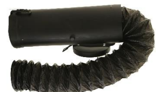
ENS43.2110 für 1500EX