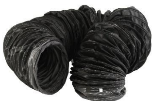
ENS43.2010 Luftschlauch für 3200EX