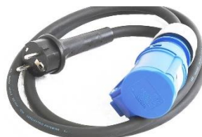
ENS43.2030 Adapter-Kabel 1.5 m