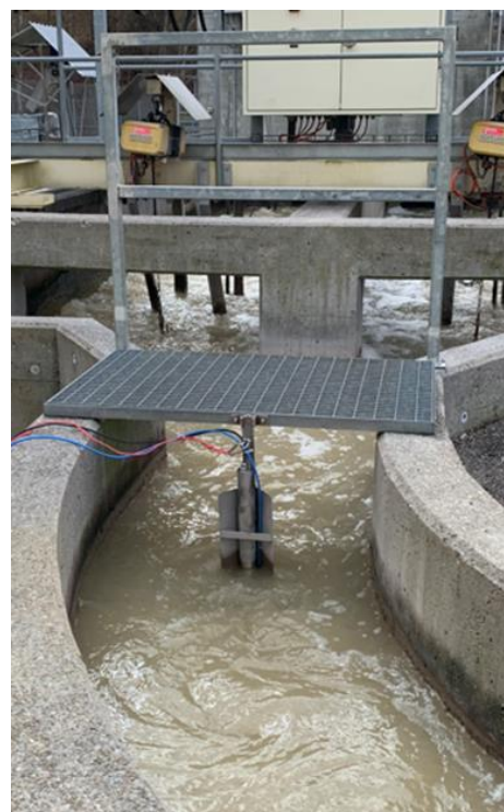
Mesure de la DCO en ligne à l'entrée de la STEP